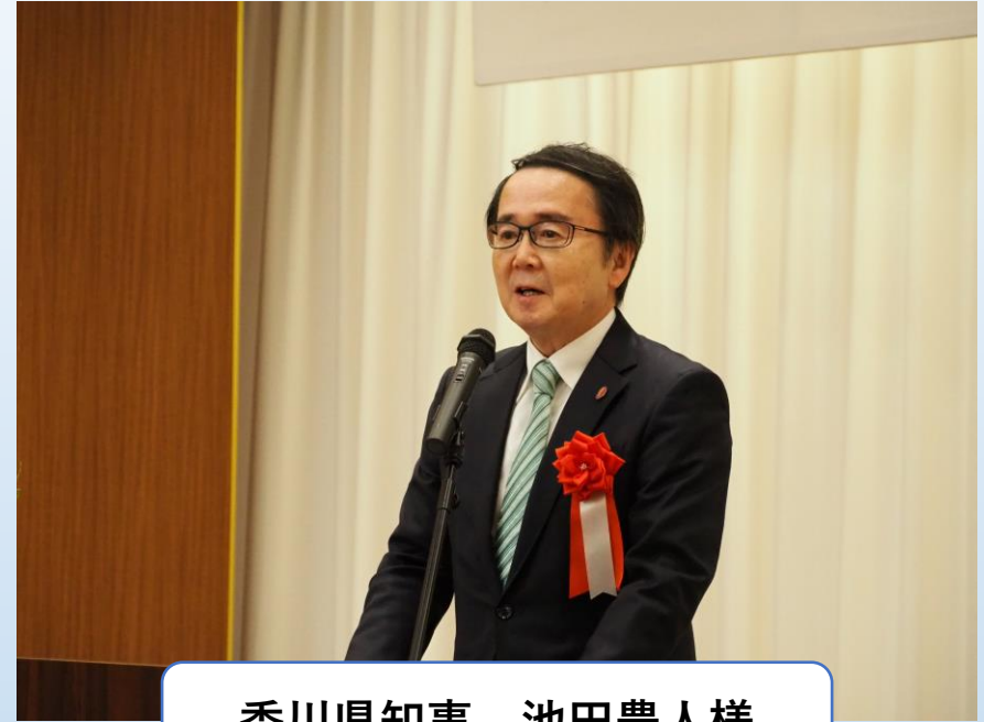
香川県知事 池田豊人様