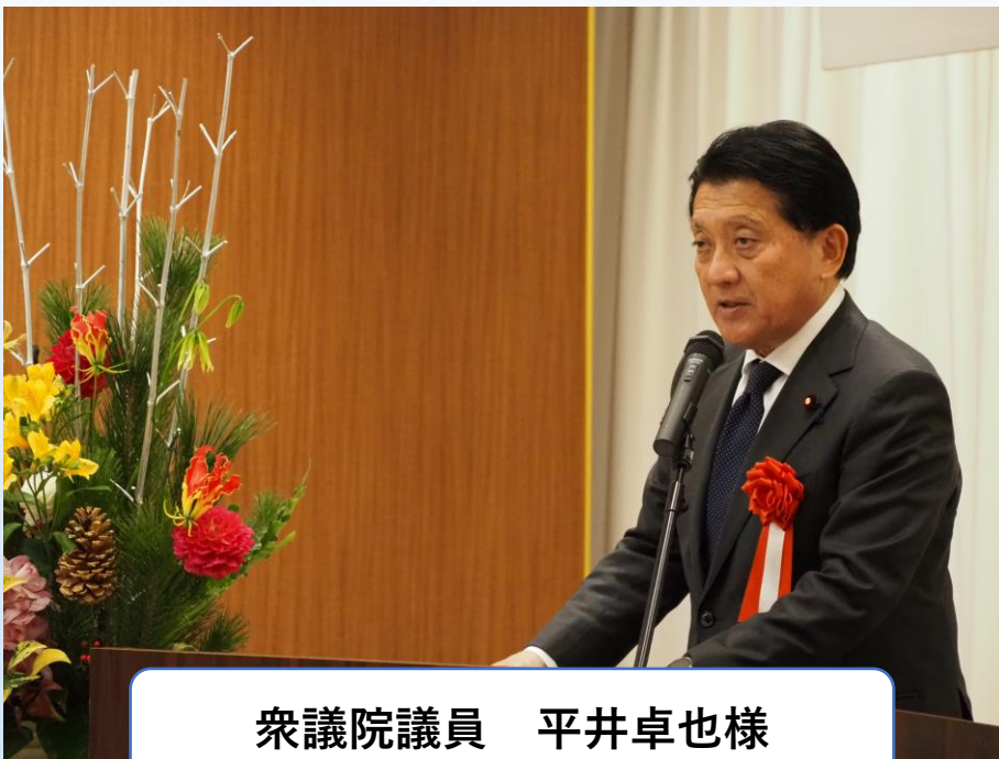
衆議院議員 平井卓也様