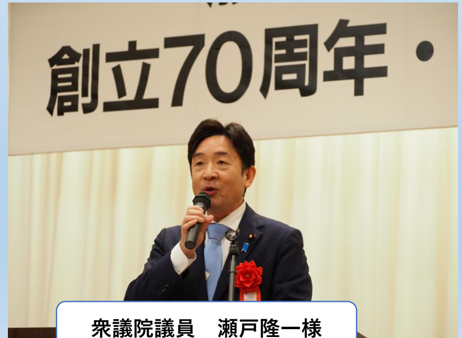
衆議院議員 瀬戸隆一様