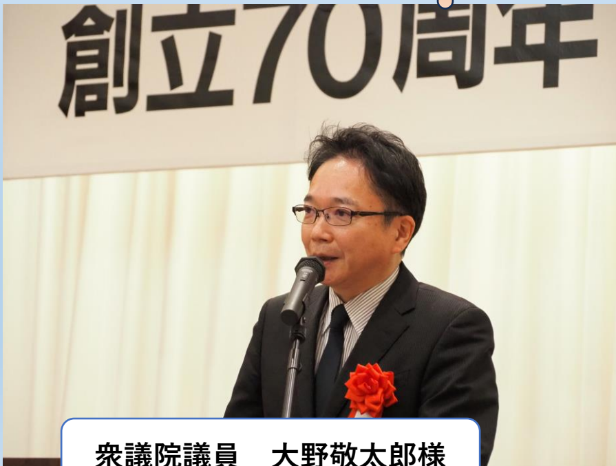
衆議院議員 大野敬太郎様