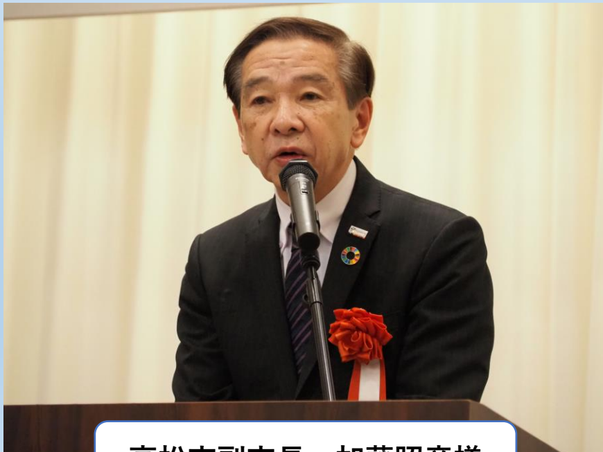
高松市副市長 加藤昭彦様