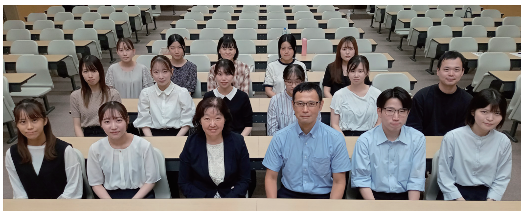
2024 年新（再）入会会員研修会集合写真

2024 年 9 月 22 日（日）、香川県立保健医療大学において「令和 6 年度新（再）入会会員研修会」が開催されました。研修会では「香川県臨床検査技師会・日本臨床検査技師会について」、「医療安全と接遇について」、「香臨技の精度管理事業について」、「技師会広報活動について」、「研究班活動について」に分けて紹介していただきました。活動内容や具体的な取り組み、今後の運用について詳しく説明していただき、学びの多い研修会となりました。特に研究班活動は分野ごとに分かれており、研修会も定期的に行われているようでした。経験が浅い人向けの研修会も開催されると知り、私も積極的に参加しようと考えています。社会人になってからもう半年が経ち、2024 年も終わりに近づいてきました。私は今年 4 月から香川大学医学部附属病院に勤務しており、血液・一般検査に配属となりました。またこの期間に研修を受けて日当直にも入りはじめました。至らない点もまだまだ多く自分の未熟さを痛感していますが、先輩方にご指導をいただきながら吸収の多い充実した日々を過ごしています。様々な患者様の検体と向き合い、検査結果で患者様の治療方針が決定されているのを目の当たりにしてきました。私はまだまだ未熟ですが、1 年目であることを言い訳にたくはありません。検査のプロとしての自覚を持ち、少しでも自信を持って業務に臨めるよう、今後も自己研鑽に励みます。