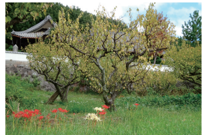
（六萬寺に咲いていた白い彼岸花）